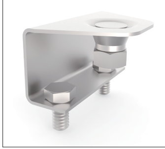
Mühür için içten vidalı arka kapak